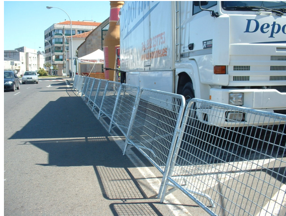
Sistema de unión de vallas mediante gancho lateral

Transporte y entrega de placas y vallas en el punto de almacenaje designado por el técnico de la FDM incluido.