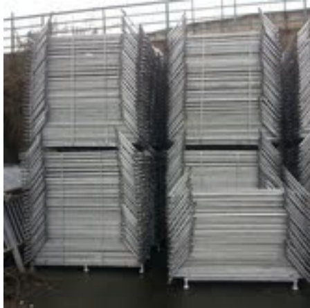
Sistema de apilado de las vallas

2.- Suministro de 14 palets metálicos de dimensiones 2000 x 1050 mm, preparado para apilar y trasladar en ellas hasta 40 unidades de valla.