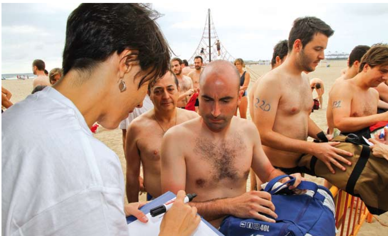
Travesía a nado GentxGent 2011.