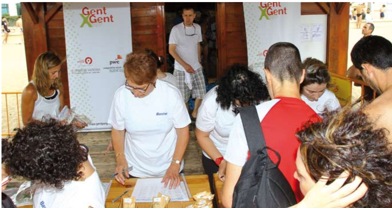
Travesía a nado GentxGent 2011.