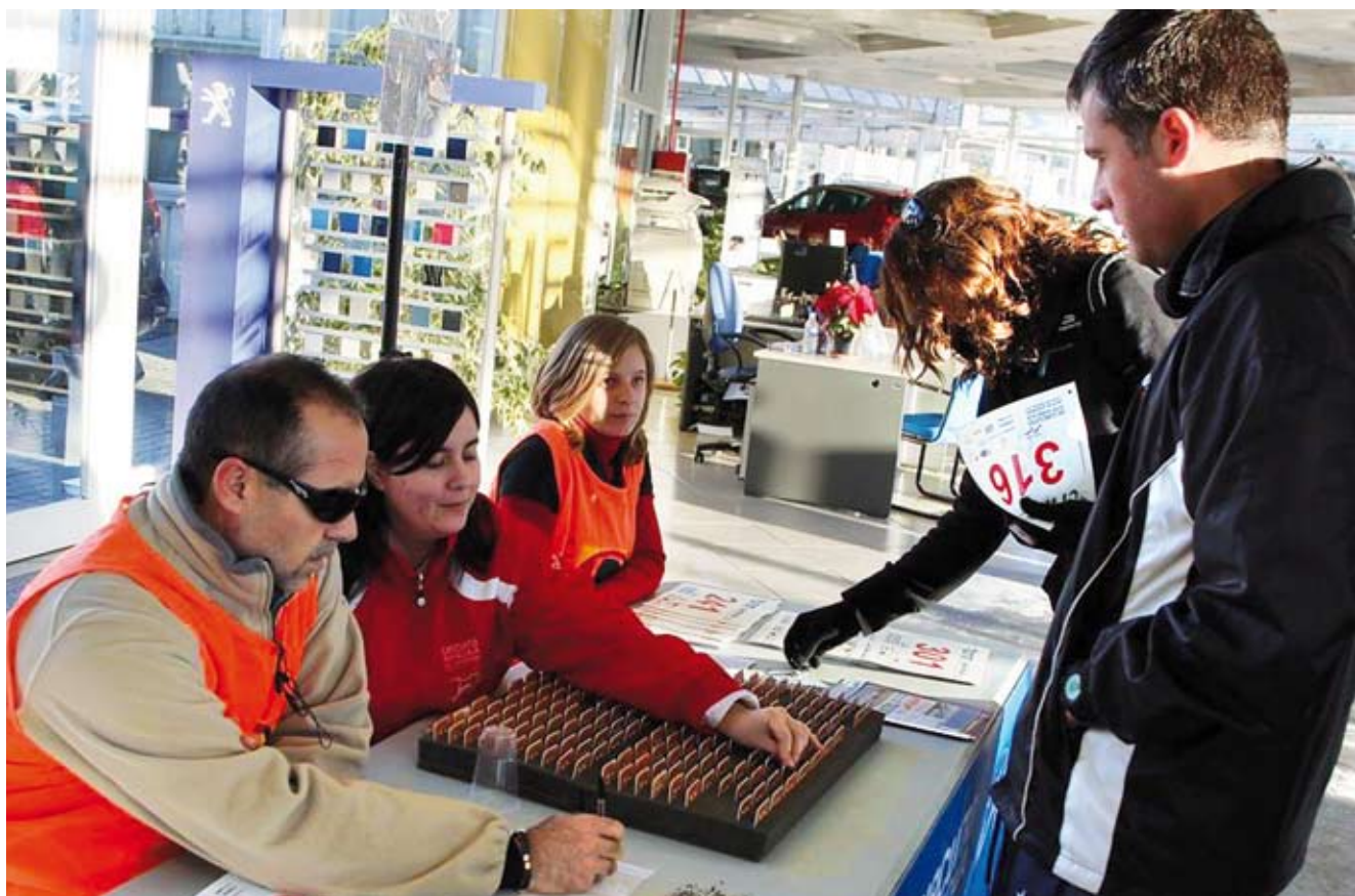
Circuito CRM de Carreras Populares de Valencia. XII Trofeo Galápagos. 2010.