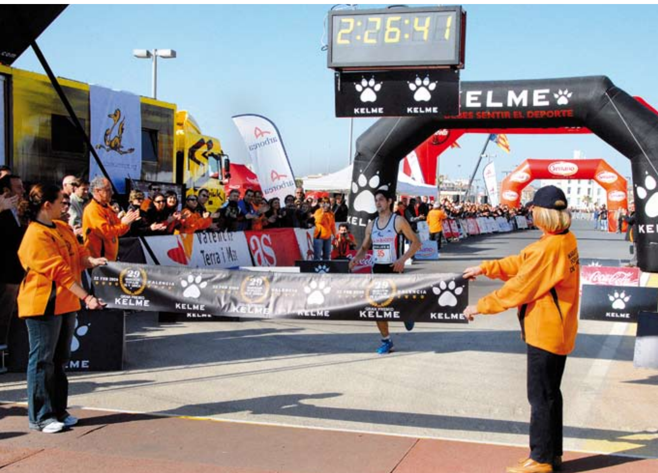
Maratón Popular de Valencia. XXIX edición. 2009.

Las personas voluntarias tienen los siguientes derechos (según la Ley 4/2001 del Voluntariado en la C.V. ):