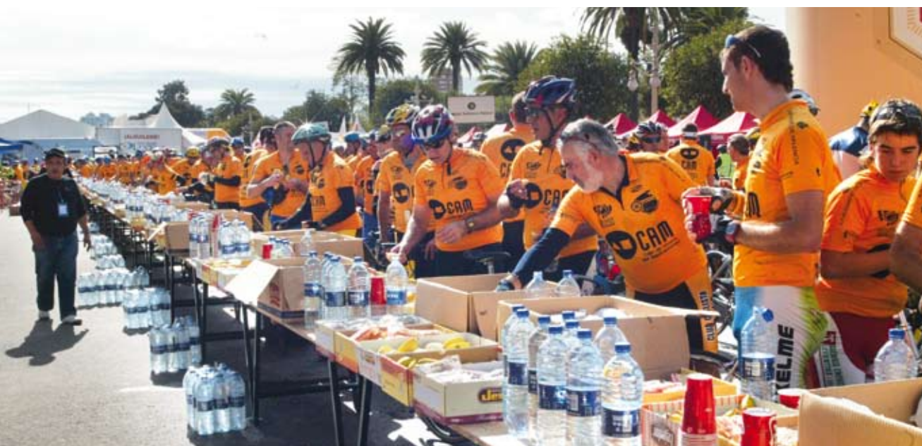
Marcha Cicloturista 2006.

En el apartado de anexos se incluye un modelo de compromiso en la actividad voluntaria para cada uno de los casos anteriores ( Anexos 9, 10 y 11 ).