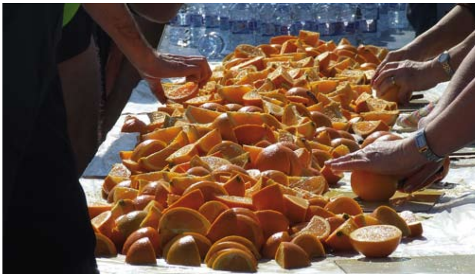
Maratón Popular de Valencia. XXX edición. 2010