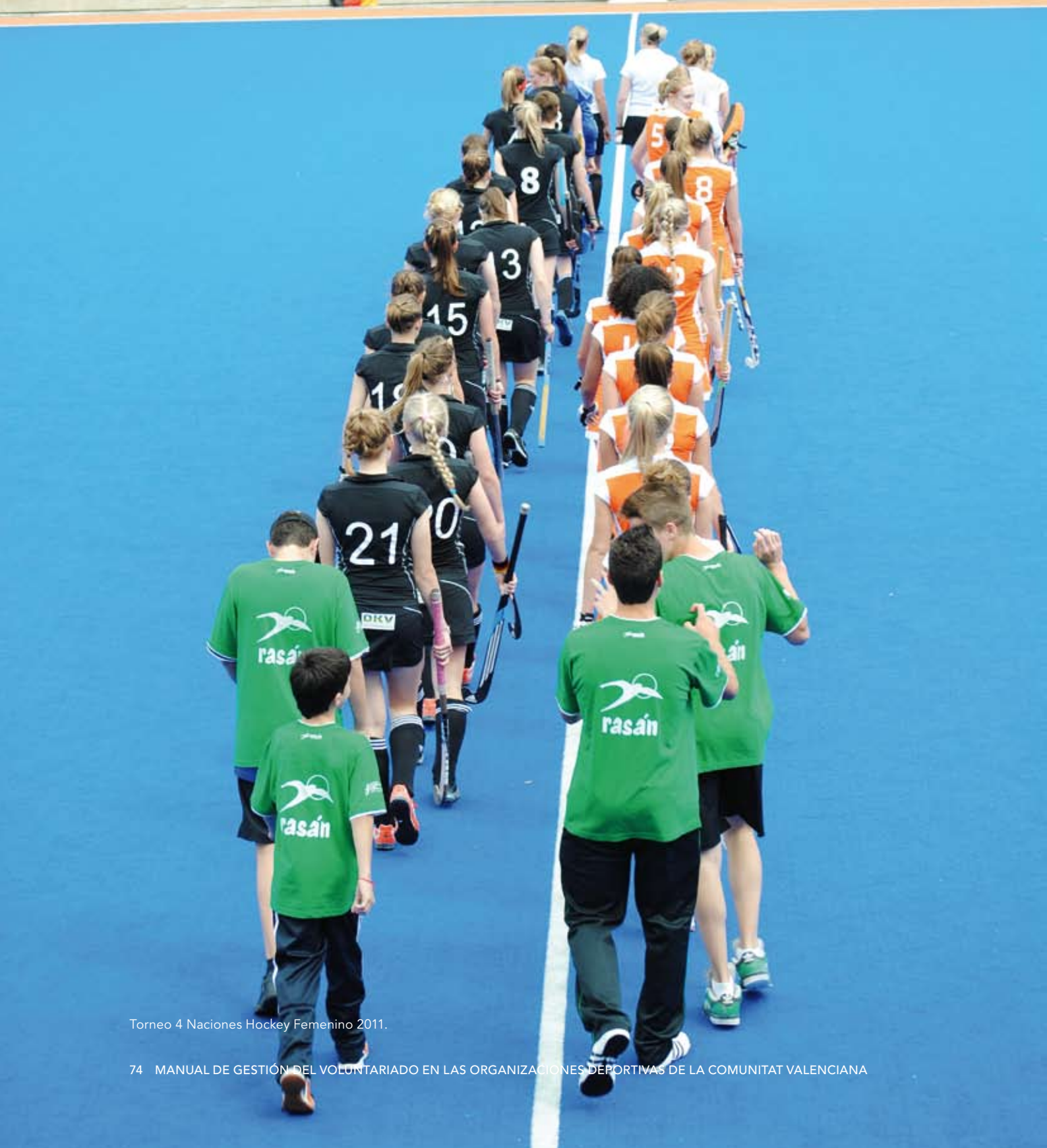
Torneo 4 Naciones Hockey Femenino 2011.