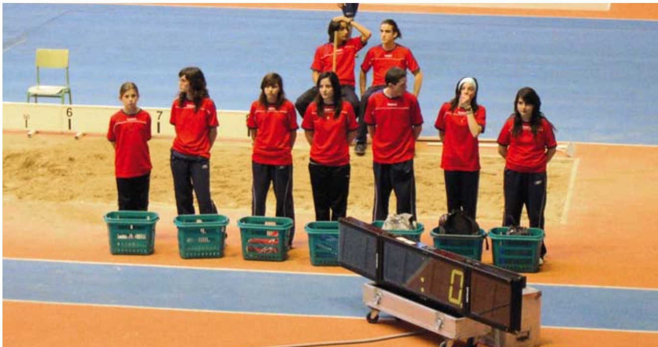
Campeonato Atletismo 2007.