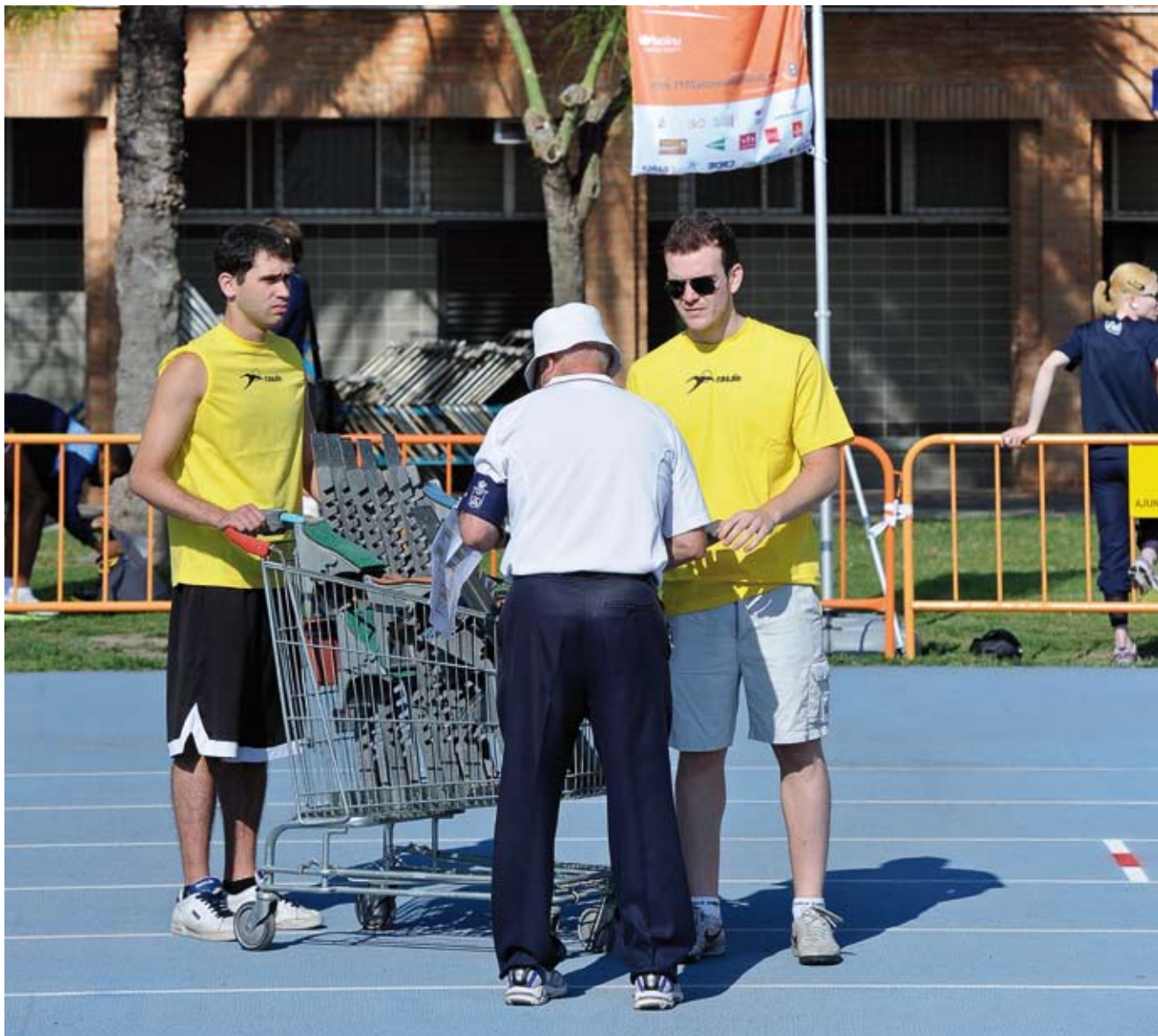
Campeonato España Atletismo Adaptado 2011.

En cuanto a la aprobación del órgano competente, deberá ser la Asamblea General de la entidad la que apruebe la inscripción en el registro y la modificación de los estatutos de la misma. Se presentará un certificado firmado por el secretario de la entidad con el visto bueno del presidente, en el cual se recoja este acuerdo y se incorpore el anexo de los estatutos.