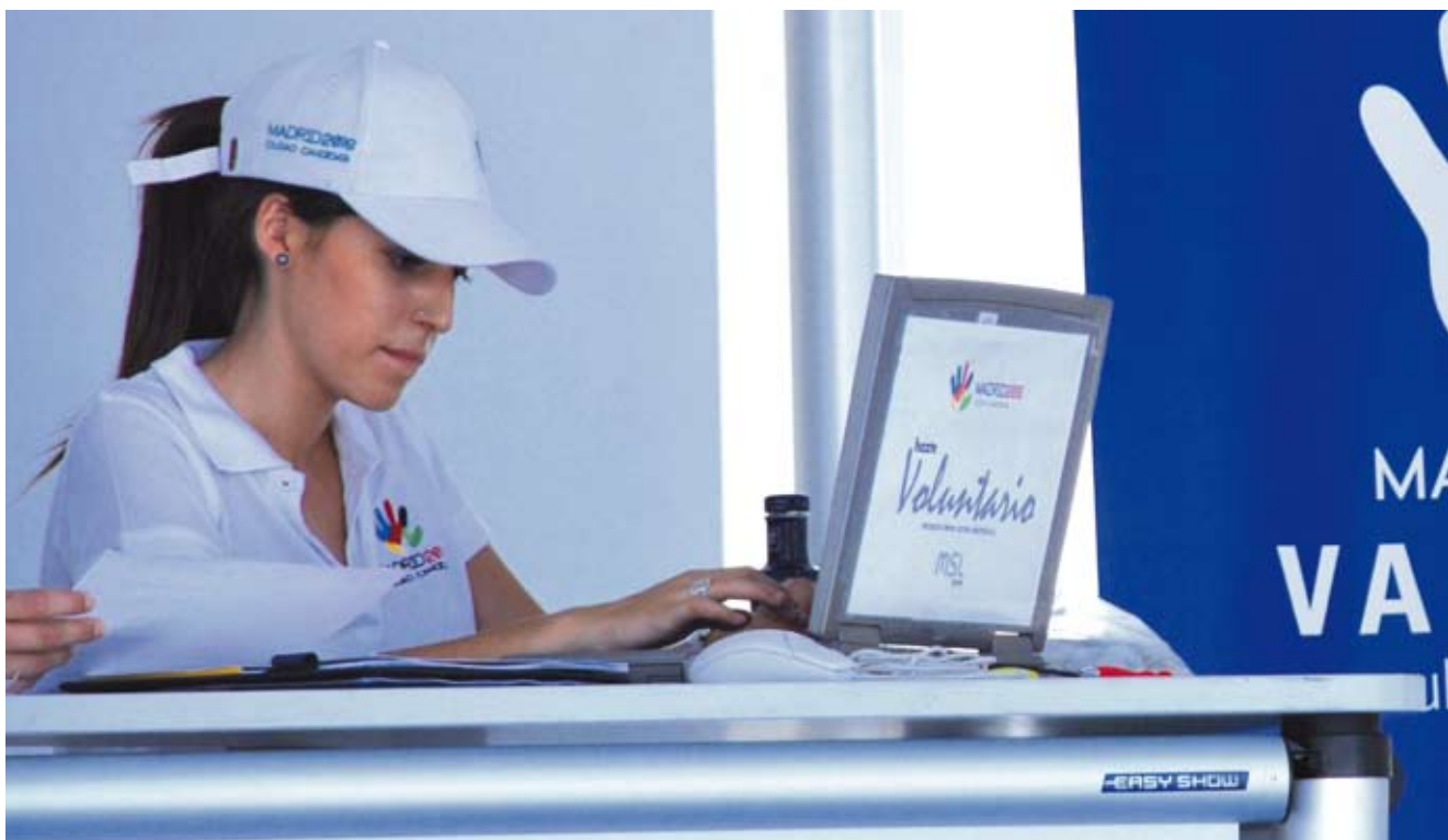
XI Trofeo Copa de la Reina de Valencia. 2009.