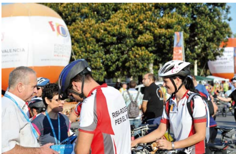
15 edición Día de la Bicicleta 2011.