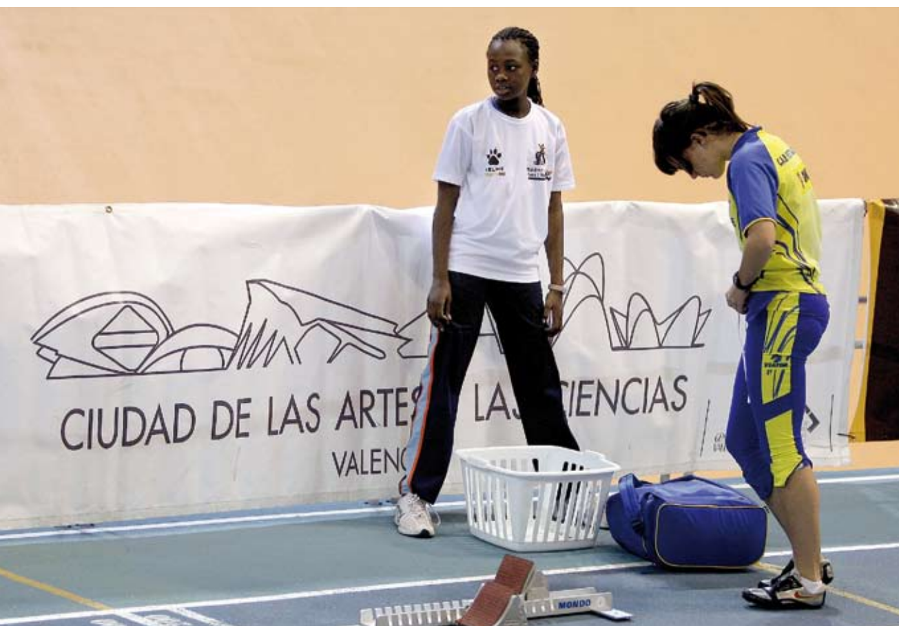
Mundial de Atletismo en Pista Cubierta 2008.

La principal diferencia entre ambos enfoques radica en que en este último no identifica el elemento democrático como una de sus características esenciales.