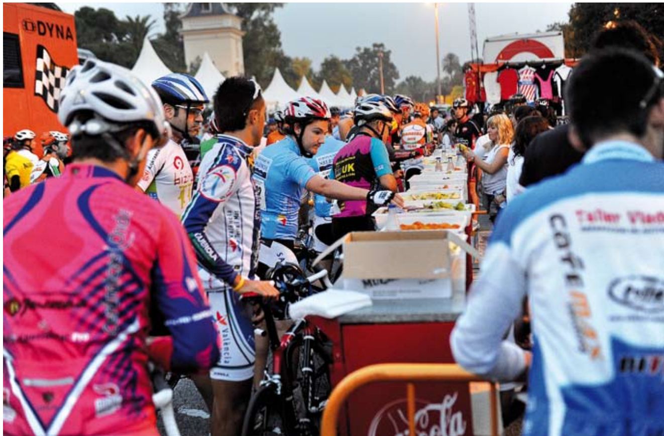
V Marcha Cicloturista- Criterium Internacional 2010.

La necesidad de contar con un número significativo de personas que realicen estas tareas o actividades, imprescindibles para asegurar el éxito deportivo u organizativo, y para asegurar el cumplimiento de las normas de seguridad; ha sido un escenario en el que sí se ha utilizado un gran número de voluntarios deportivos.