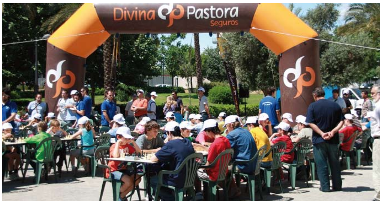
Ajedrez Juego Limpio 2009.

Además, hay que tener en cuenta que toda actividad desarrollada por el personal voluntario tiene que formar parte de un proyecto concreto y determinado con anterioridad.